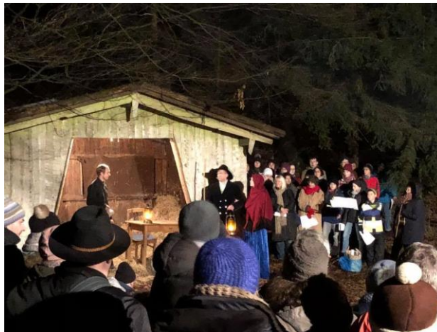
Die Ursensollener Waldweihnacht im Dezember 2017 brachte für HAYAG einen Erlös von 850 Euro ein.