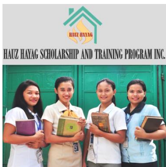
Vier unserer „Residentials“ auf dem Weg zur Universität.

Das Projekthaus platzt regelrecht aus allen Nähten. Aktuell leben 33 Mädchen, die sogenannten „ Residentials “, im Haus HAYAG. Wie Sie wissen wohnen, lernen und arbeiten diese Mädchen zwischen 15 und 22 Jahren im Haus, gehen zur Schule, zum College oder zur Universität und bleiben bei uns solange bis sie einen Abschluss UND eine Arbeitsstelle sicher haben.