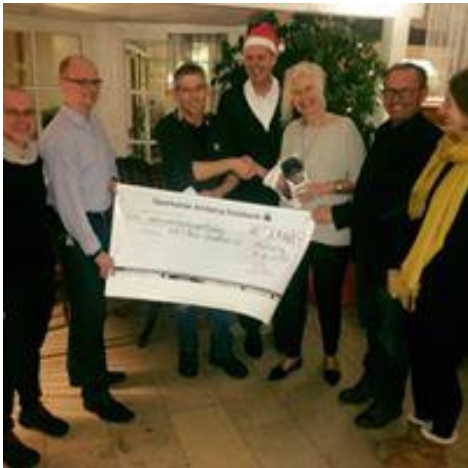
Knapp 2.000 Euro erhielten wir vom Amberger Ultralauf aus dem Nov 17

Bereits im Dezember 2017 erhielten wir den gesamten Erlös des Amberger Ultralaufs (AULA) der seit 2004 immer zu Gunsten von HAYAG stattfindet. Der AULA hat bei 14 Veranstaltungen bereits mehr als 40.000 Euro für HAYAG erlaufen. Danke den Organisatoren dafür.