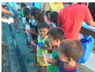
Das Feeding für Straßenkinder im Haus HAYAG findet jeden Sonntag mit bis zu 200 Kindern statt.

Aktuell testen wir ein gezieltes Nahrungsergänzungsprogramm das bestimmte Straßenkinder täglich mit den erforderlichen Mahlzeiten und Nahrungsergänzungen versorgen. Auch das ist wichtig wenn die Kinder in der Schule auch Leistung erbringen müssen.