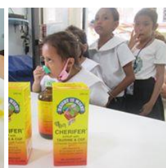
Nahrungsergänzungen u. medizinische Versorgung als Test! Können wir diese Hilfe dauerhaft leisten ??

Hayag International e. V., E-Mail: info@hayag-project.com , Internet: www.hayag-project.com Bank: VR-Bank Amberg eG, Konto 193 399, BLZ 752 900 00, IBAN: DE4975290000000193399, BIC: GENODEF1AMV