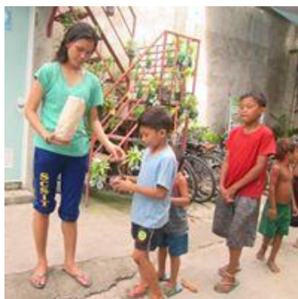
Die Residentials kümmern sich auch rührend um die anderen beiden Säulen.